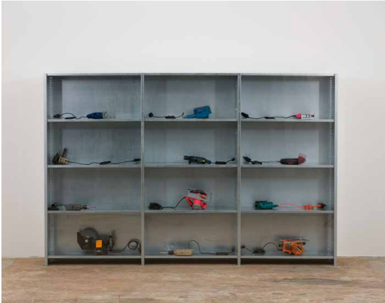
Etagères, 2007 outils, minuteur, 304 x 38 x 200 cm, Unique, (Ref. rei06) crédits Yann Bohac