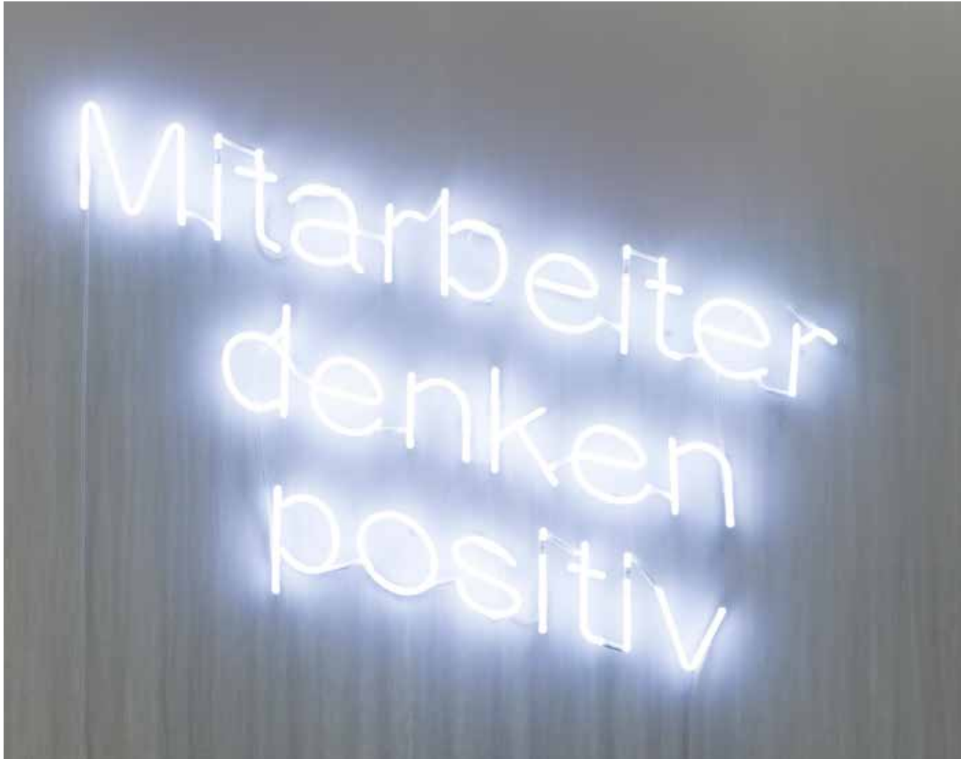
Mitarbeiter, denken positiv, 2017 tubes de néon, 120 x 120 cm, 2/3, (Ref. rei02)