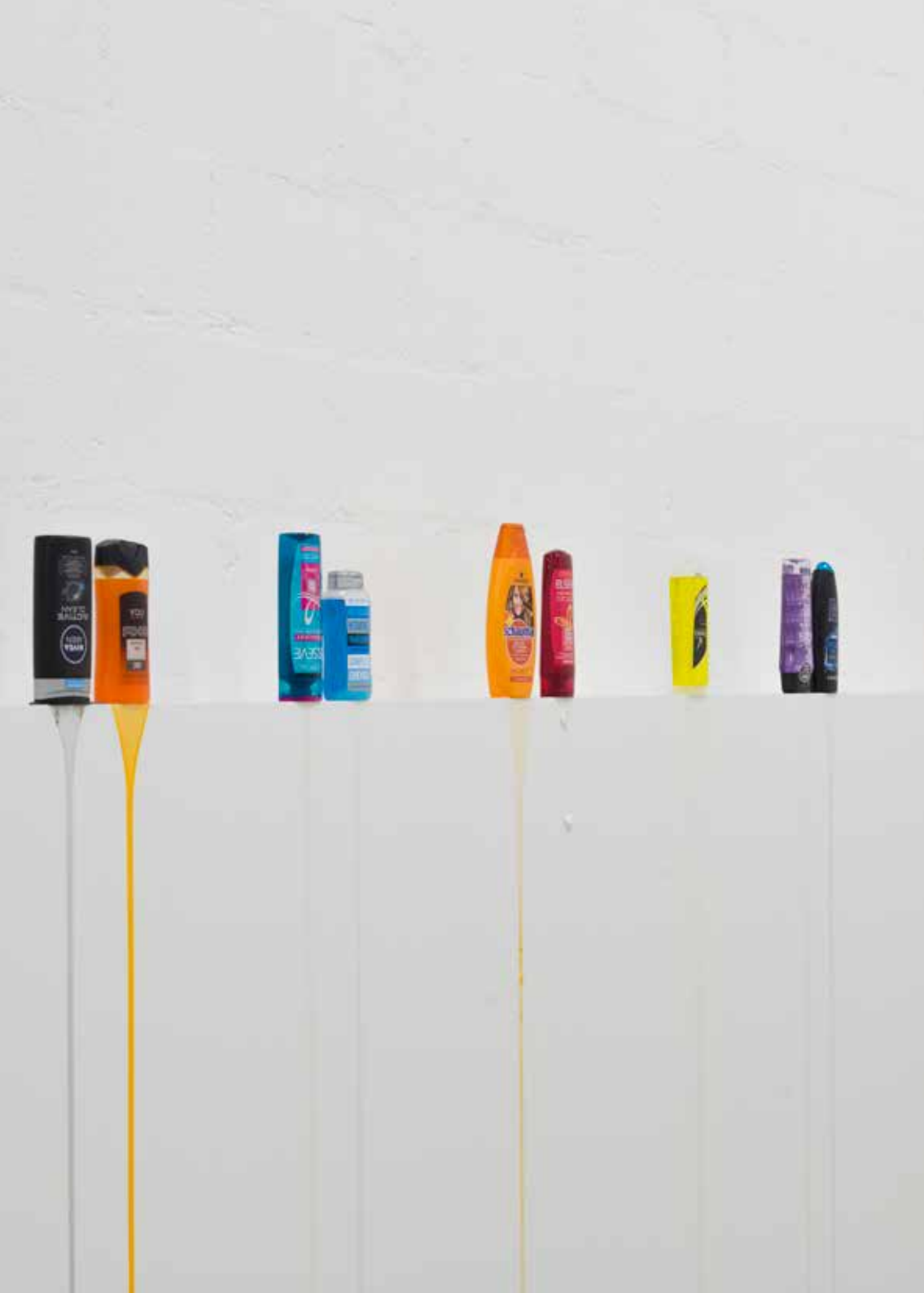
douches , 2020 shampoings, socle, dimensions variables, Unique, (Ref. rei04)