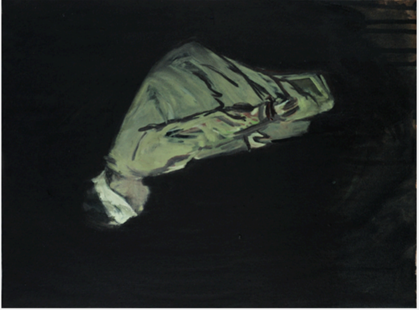
Claire Tabouret, Les yeux bandés 1, 2013, 35x27