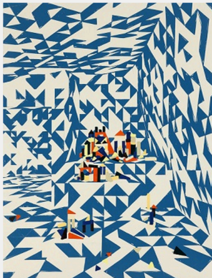
Farah Atassi, Modern toys II, 2013, 200x160

Comme toutes les galeries ou presque se sont donné le mot pour rouvrir leurs portes le 7 septembre, il faut tenter de faire resurgir quelques impressions du marathon des vernissages. Alors parlons d'abord de peinture. Chez Xippas , Farah Atassi présente (jusqu'au 26 octobre) des toiles toujours aussi grandes et géométriques, mais où apparaissent maintenant des obliques, des pliages, des motifs folkloriques cohabitant avec ceux du Bauhaus et du modernisme; ces toiles semblent donner plus d'espace à l'aléatoire, au 'disharmonieux', à une certaine forme de rondeur même. Elle est nommée pour le Prix Marcel Duchamp , rendez-vous dans six semaines.