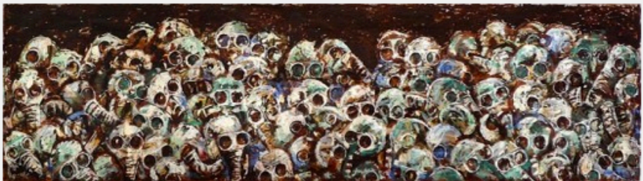
Mauro Bordin, Risque zéro, 2013, huile sur papier, 94x355

À la galerie Estace (jusqu'au 5 octobre), Mauro Bordin explore la nature (Die Natur, d'après Wozzeck), une nature parfois luxuriante, sauvage, menaçante, aux plantes venimeuses, carnivores, piquantes ou urticantes en grand format; y apparaissent parfois des mains qui se tordent, ou des pieds (est-ce là un pendu, ou bien un allègre sauteur ou un pieux lévitant ?) et alors la végétation semble perdre ses couleurs, se brunir, se rabougir, comme si la sève s'en était allée. Il y a là des bribes d'une histoire inconnue, un parcours entre des récits qu'il nous appartient de poursuivre, mais dont on perçoit constamment, même devant les petits formats plus bucoliques, la dimension tragique, qui nous suit et nous oppresse, jusqu'à la dernière salle au fond, où ce grand format horizontal nous accueille : rien à voir avec la Syrie, mais ces masques à gaz sur des crânes semblent a posteriori donner le la à toute l'exposition.