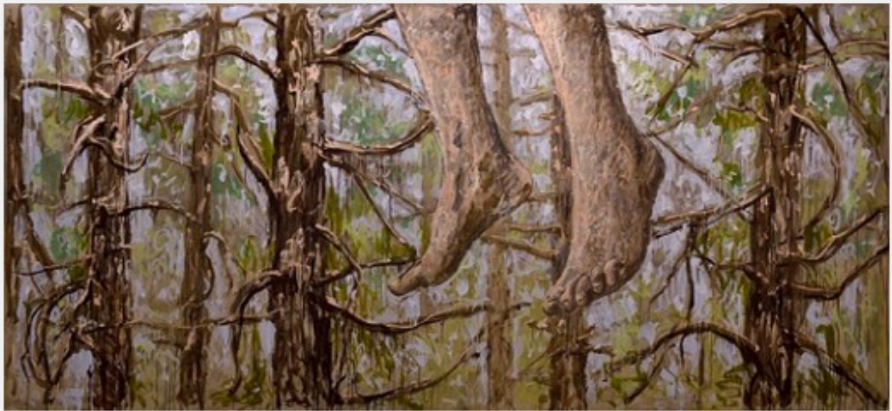
Mauro Bordin, Cedrus libanji with peduncoli sollevata, 2013, huile sur papier, 150x335

À la galerie Estace (jusqu'au 5 octobre), Mauro Bordin explore la nature (Die Natur, d'après Wozzeck), une nature parfois luxuriante, sauvage, menaçante, aux plantes venimeuses, carnivores, piquantes ou urticantes en grand format; y apparaissent parfois des mains qui se tordent, ou des pieds (est-ce là un pendu, ou bien un allègre sauteur ou un pieux lévitant ?) et alors la végétation semble perdre ses couleurs, se brunir, se rabougir, comme si la sève s'en était allée. Il y a là des bribes d'une histoire inconnue, un parcours entre des récits qu'il nous appartient de poursuivre, mais dont on perçoit constamment, même devant les petits formats plus bucoliques, la dimension tragique, qui nous suit et nous oppresse, jusqu'à la dernière salle au fond, où ce grand format horizontal nous accueille : rien à voir avec la Syrie, mais ces masques à gaz sur des crânes semblent a posteriori donner le la à toute l'exposition.