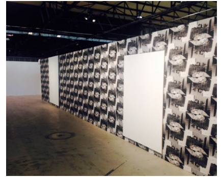
Vue de l'installation de Paul Czerlitzki sur le stand de Laurent Godin (Paris), sur Art-O-Rama 2014.