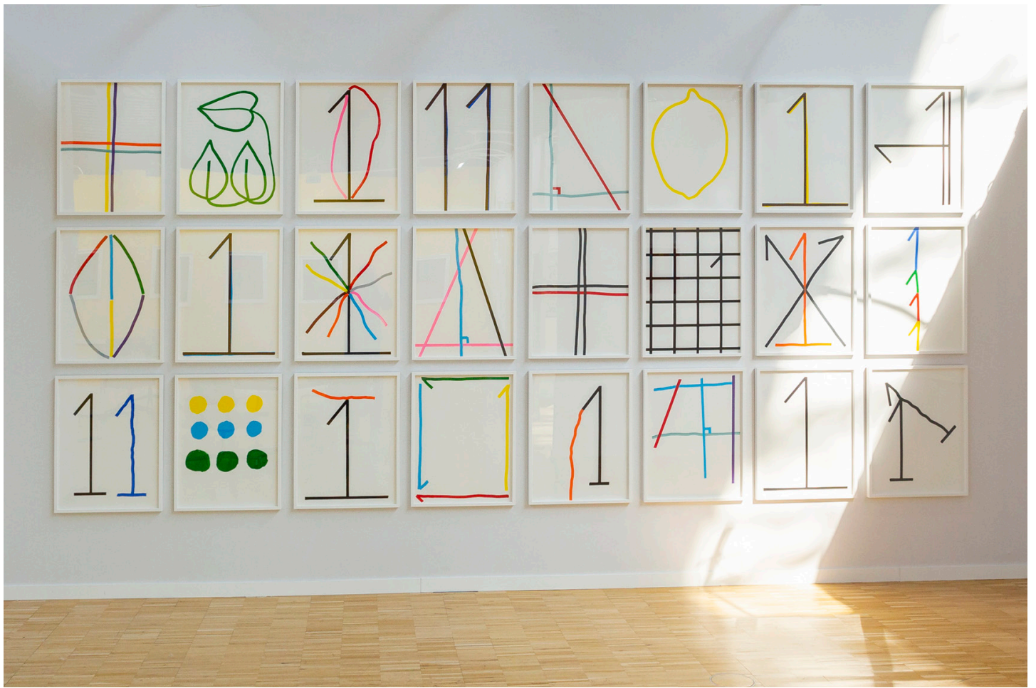
Michel Dector Série de dessins sans titre Feutre acrylique sur papier 65 x 50 cm chaque Unique