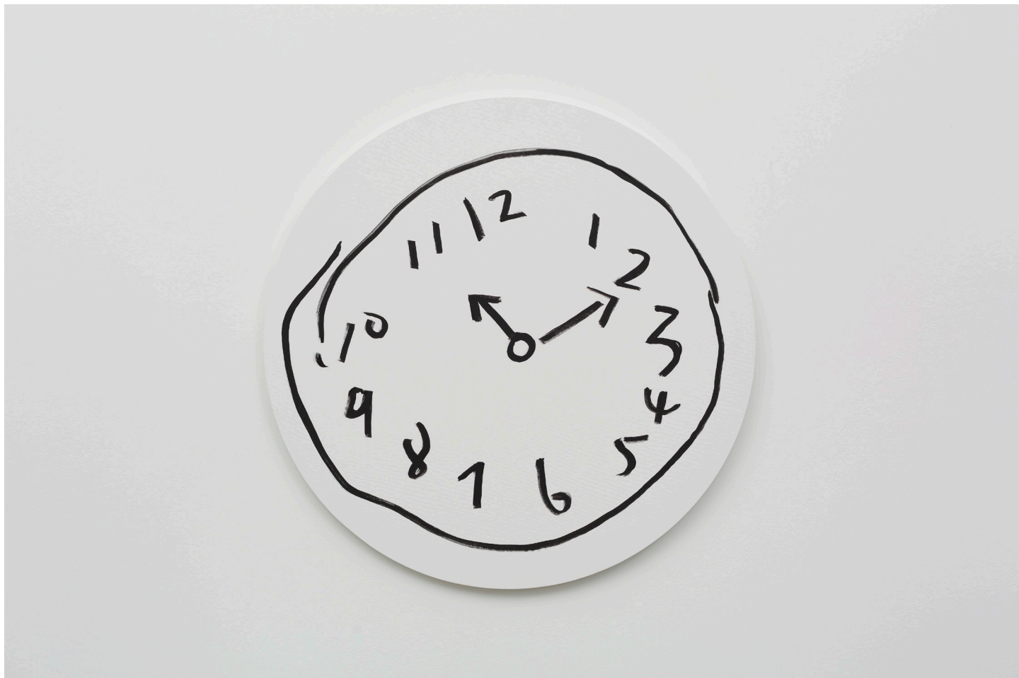
O'clock , 2021 Acrylique sur toile 80 cm (diam) Unique (Ref. cof252)

Né en 1979. Vit et travaille à Paris, France.