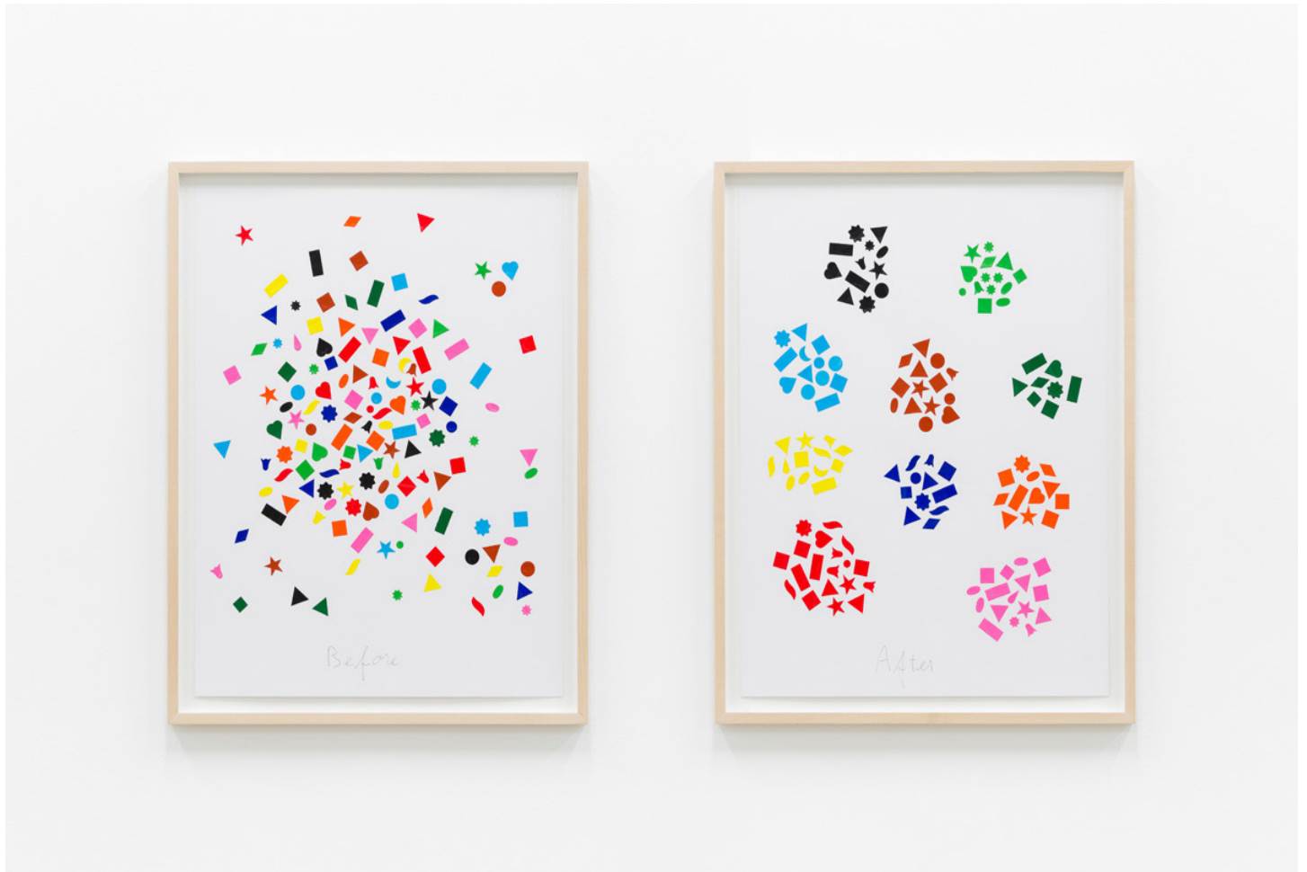
Before and After (colors), 2004 Commettes autocollantes et stylo bille sur papier 70 x 56 cm chaque Unique (Ref. cck0122907)

Né en 1963. Vit et travaille à Paris, France.