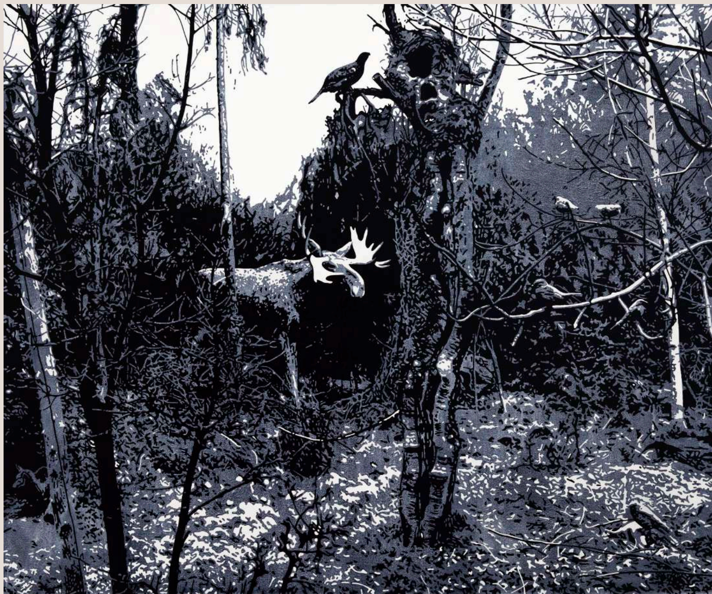
Frozen Orbit 4:08 a.m. , 2012 - 2017

Technique mixte sur toile, 180 x 216 cm, unique