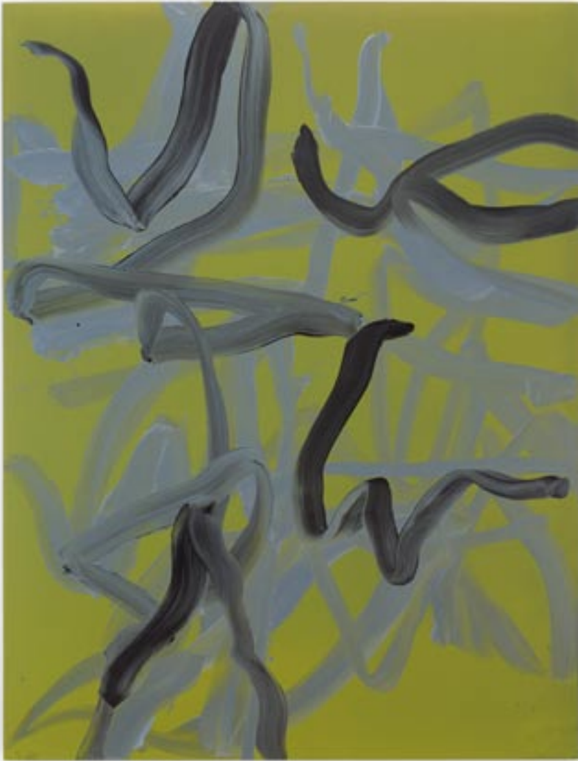
Gérard Traquandi Telemark , 2005 275 x 200 cm huile sur toile